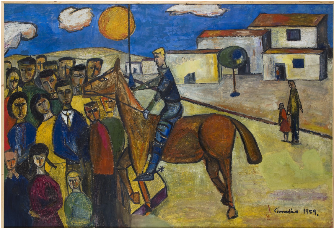
Sant Jordi (1959). Oli sobre paper. 134,5 x 196 cm. Museu d'Art. Donació de l'Agrupament Escolta Sant Narcís

Taula rodona al voltant de la trajectòria i l'obra pictòrica de Comadira, moderada per Jordi Falgàs.